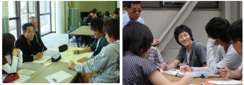
『アクティブラーニングと科学』

5つの共創型学習科目、4つの教養科目に社会人ボランティアの方が参加し、学生と共に学びました。その一部をご紹介します。