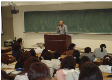
『心とからだの健康』