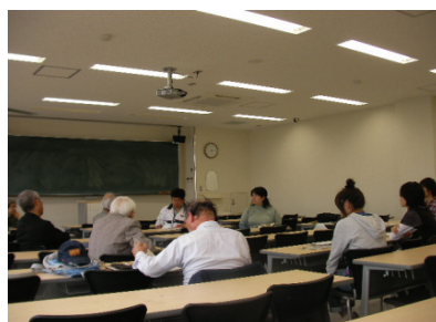
『名著講読～生きがいを考える～』