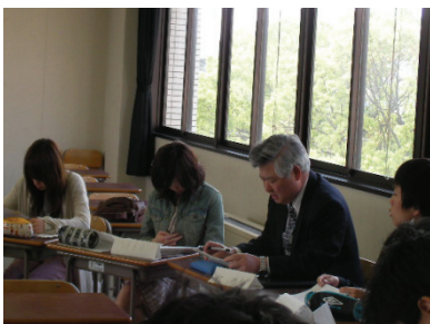
『名著講読～世界の見方～』